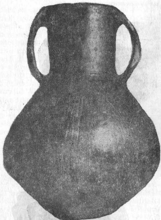
Fig. 2. Peteni. Amforă.

Materialul ceramic este variat și bogat. Pe lângă tipurile de vase deja cunoscute, în anul acesta a apărut un nou tip de vas, amfora cu două toarte. Forma ei se înscrie în tipul vaselor cu gîtul înalt și toarta înaltă, cunoscute din perioada timpurie a epocii bronzului, din cultura Schneckenberg și Ciomortan 3 . Prin urmare arată o tradiție legată de culturile locale din epoca bronzului timpuriu din sud-estul Transilvaniei. În campania de săpătură din anul 1978, ca și în anul 1979, au fost găsite fragmente de vase de aspect de cultură din prima vîrstă a fierului 4 (Hallstatt A, fig. 3/1—5). Un fragment decorat cu triunghiuri cu capetele petrecute prezintă un ornament caracteristic pentru cultura Ciomortan (fig. 3/1, fig. 4/5). Acest fapt arată că materialul ceramic găsit în așezarea de la Peteni a păstrat unele forme și ornamente caracteristice pentru culturile atestate la începutul epocii bronzului în această regiune.